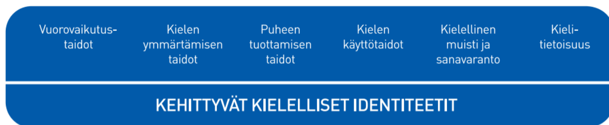
Kuvio 2. Lasten kielen kehityksen keskeiset osa-alueet varhaiskasvatuksessa

Kielen oppimisen kannalta on tärkeää tiedostaa, että saman ikäiset lapset voivat olla eri vaiheissa kielen kehityksen eri osa-alueilla. Kielelliset identiteetit kehittyvät , kun lapsia ohjataan ja tuetaan kielellisten taitojen ja valmiuksien keskeisillä osa-alueilla.