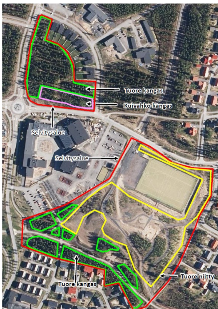
Luontoselvityksessä esitetyt luontotyypit alueella.

Lajitieto tarkistettu laji.fi-palvelusta 23.1.2023, eikä alueella ole sen mukaan havaittu vaarantuneita, uhanalaisia tai direktiivilajeja. Jatkuvasti märkänä pysyviä kosteikkoja ei esiinny. Alueen metsät eivät ole merkittävä lisääntymis- tai levähdysalue linnuille, sillä ne ovat heikkojen rakennepiirteidensä ohella pienialaisia, jossain määrin eristyneitä (Linnakangastalon ympäristön asemakaavan luontoselvitys 2023).