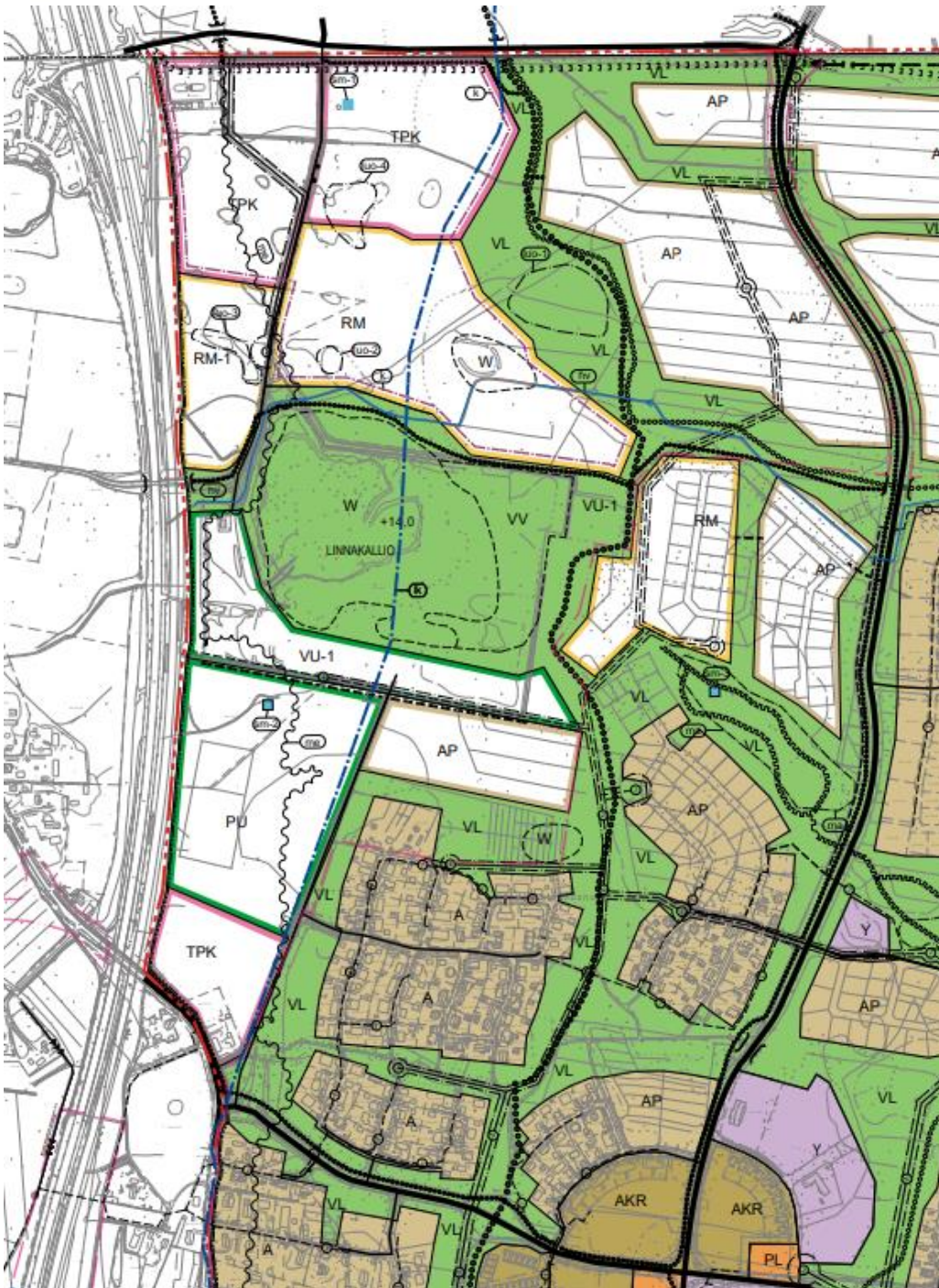
Ote Linnakankaan osayleiskaavasta (lv 26.6.2019).