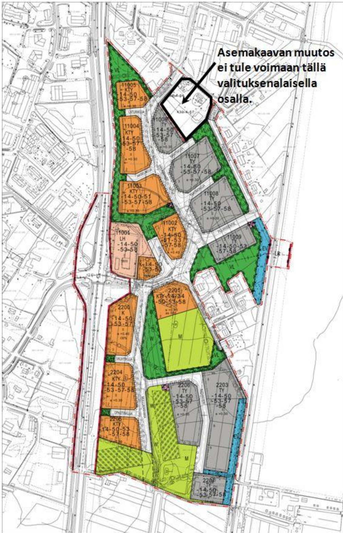
Voimaantuleva alue värillisenä kaavakarttaotteena.