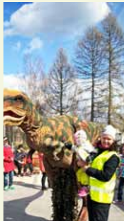
Wapputapahtumassa esiintyvä dinosaurus oli lasten mieleen.

raiijatjuopperi@gmail.com , puh.0407544463